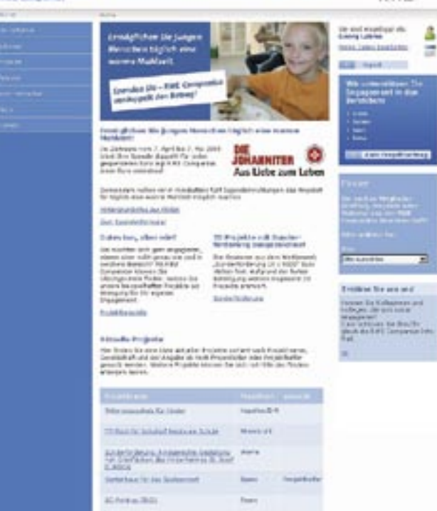
Menschen machen's möglich RWE Companius

Auch der RWE-Konzern beschloss 2005 eine grundlegende Neuausrichtung seiner CSR- und Sponsoringstrategie. Gesucht wurde ein langfristiges, glaubwürdiges und sichtbares CSR-Engagement für ein gesellschaftlich relevantes Thema im direkten Umfeld der Kunden. Ziel war es, das Profil als verantwortungsbewusstes und gesellschaftlich engagiertes Unterneh-