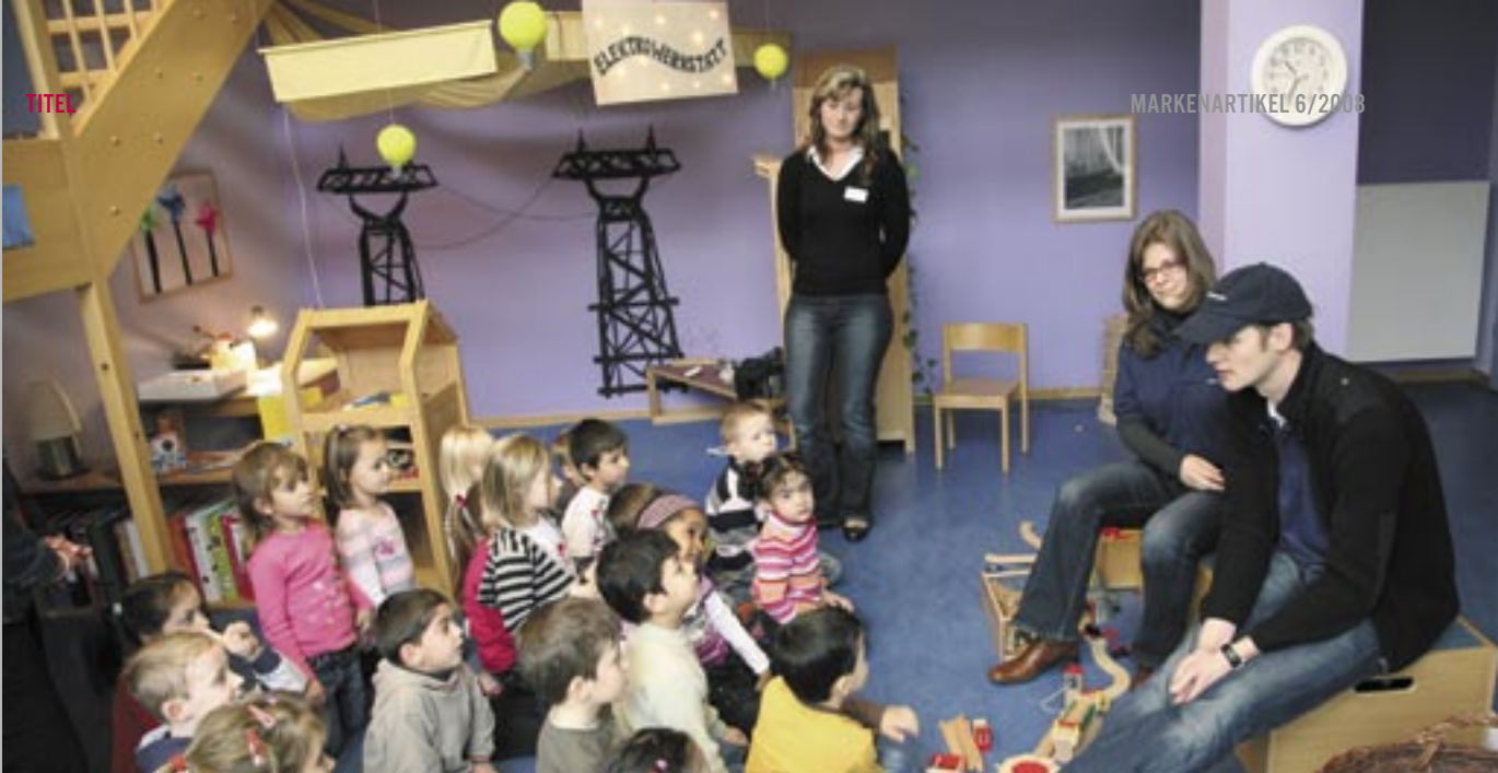
Mitarbeiter von RWE organisieren einen sozialen Tag im Kindergarten – dabei tragen sie Outfits im RWE Companius Design

Plattform zur Verfügung. Der Gedanke dahinter: Die Mitarbeiter sind nah dran an den Problemen ihres sozialen Umfelds und wissen am besten, wo ihre Hilfe gebraucht wird. Das Motto von RWE Companius lautet: »Menschen machen's möglich«.