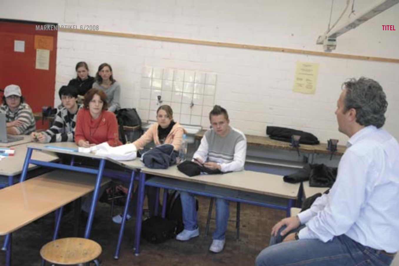
Die Bandbreite der Projekte reicht von Betreuung und Nachhilfe über Training im Jugendsport bis hin zu Unterstützung in Sachen Energieeffizienz

men mit starker regionaler Verwurzelung zu schärfen und Mittel effizienter einzusetzen. Zum einen ging es dabei um die Verlagerung vom klassischen Sponsoring hin zu mehr Gemeinwohlorientierung, zum anderen um die thematische Bündelung des Großteils der CSR-Aktivitäten im Konzern unter dem Dach »Jugend-Bildung-Zukunft«.